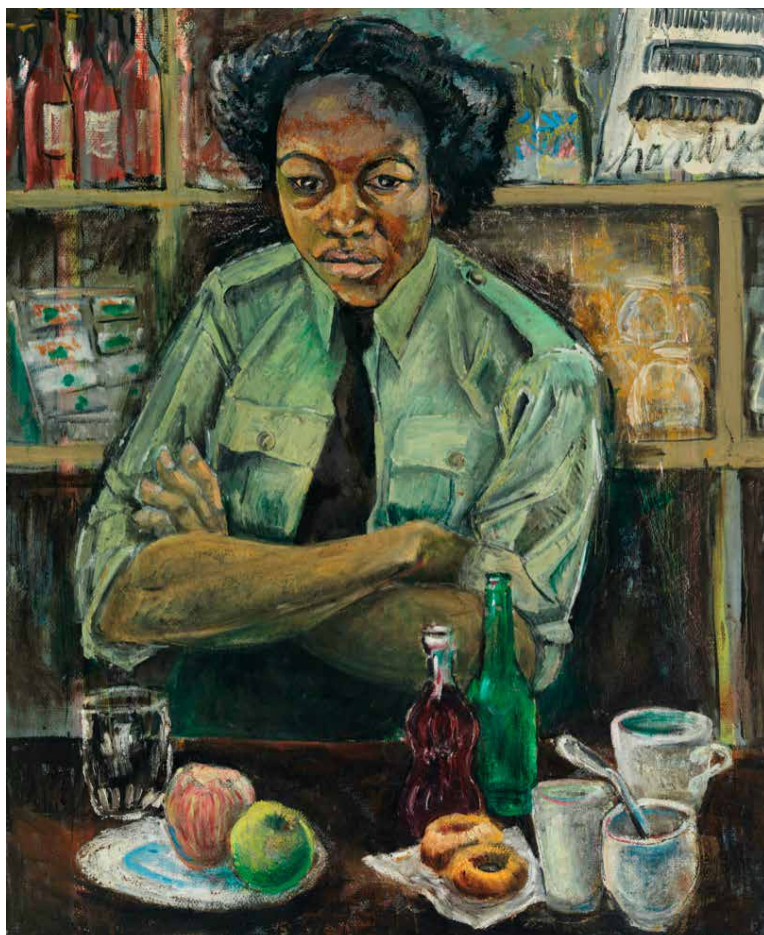
Peinture de Molly Lamb Bobak, 1946 Première femme nommée artiste de guerre au sein de l'armée canadienne